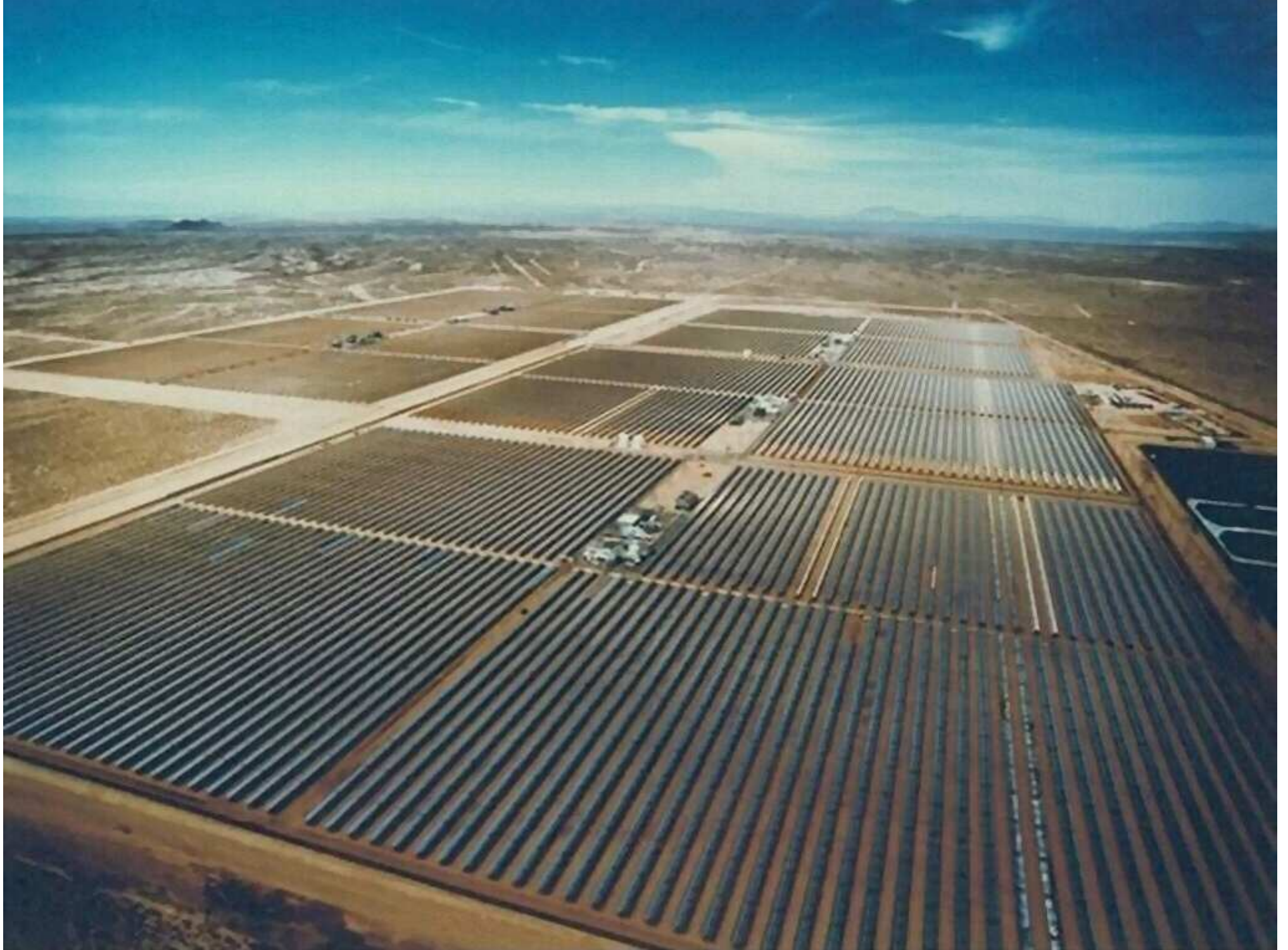
Aerial view of the solar power stations SEGS III to VII (Solar Electric Generating Systems), KJC, Kramer Junction, California, with an installed capacity of 30 MW each.